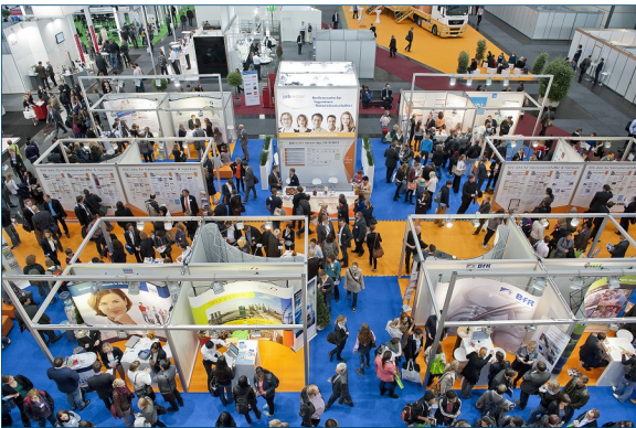
Bild2: jobvector career day