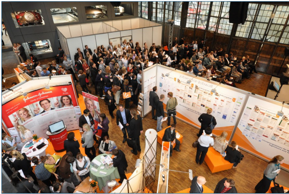
Bild1: jobvector career day