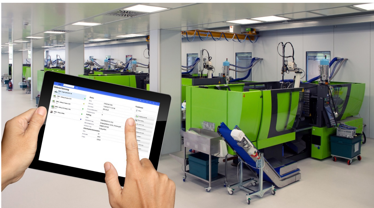
Die mobile Datenerfassung mit den neuen, ergonomischen Apps erleichtert den Fertigungsalltag erheblich