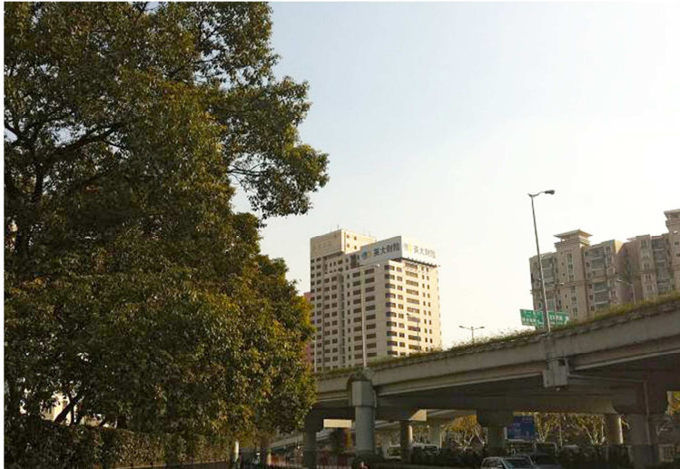
Bildunterschrift: Sitz der chinesischen Niederlassung CADENAS China Ltd. in Shanghai.