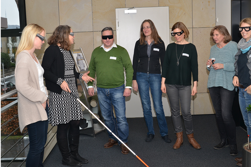
Abb. 2: Die Seminarteilnehmer lernen den Nutzen einer kontrastreichen Raumgestaltung schätzen, als sie anhand spezieller Brillen erfahren, was es bedeutet eingeschränkt sehen zu können