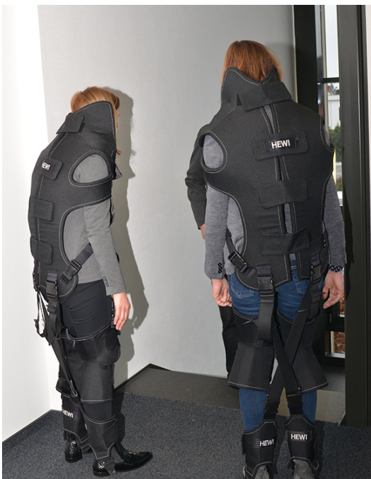
Abb. 3: Im Alterssimulationsanzug bekommen Treppen und (fehlende) Haltegriffe eine ganz neue Relevanz

Ansprechpartner Presse im Unternehmen: Jung Pumpen GmbH Dr.-Ing. Andreas Kämpf Industriestraße 4-6 33803 Steinhagen Telefon +49 5204 17-320 Telefax +49 5204 17-133