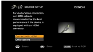
Advanced GUI AVR-3312/AVR-2312

http://www.denon.eu/downloads/press/2011_05_AVR-xx12/Source_Setup.jpg