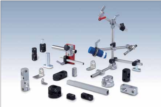
Klemmhalter, Haltestangen und Halterohre in verschiedenen Ausführungen