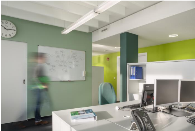
Büro 1: IMG_009_Modell_1jpg

Vom Schreibtisch aus hat jeder Beschäftigte eine grüne Wand im Blickfeld. Die übrigen Wände sind in einem hellen Graugrün gehalten– diese Farbe beruhigt und sorgt für eine „Farbpause“.