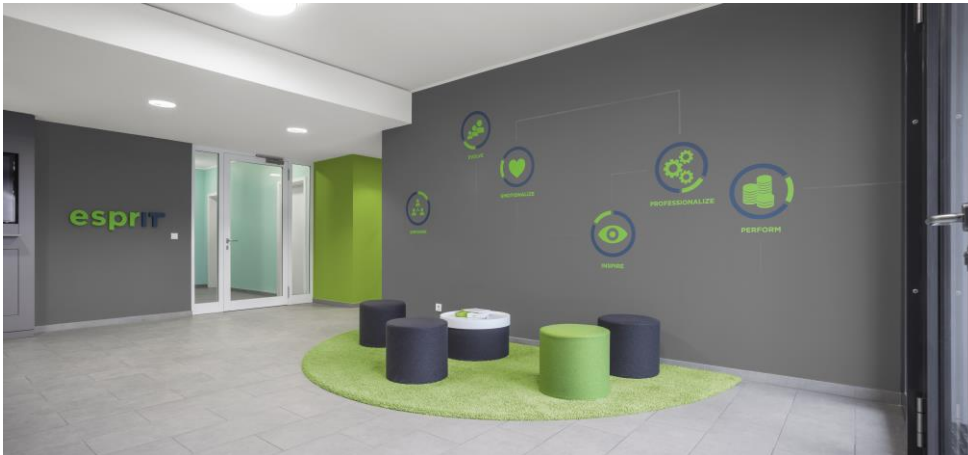
Foyer 1: Caparol-IT-Foyer-3.jpg

Im Foyer des IT-Neubaus der DAW korrespondiert frisches Grün mit dunklem Grau. Die Piktogramme an der Wand stehen für „emotionalize, empower, evolve, inspire, perform, professionalize“. Ihre runde Form wiederholt sich in Teppich und Sitzhockern.