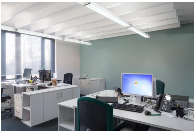
Büro 2: IMG_0246_LEER_bearb.jpg

Farbe soll die Lust am Arbeiten fördern, aber nicht dominant sein. In diesem Büro ist die Konzentration auf die Arbeit ungestört möglich. Wand und Bürostuhl korrespondieren farblich miteinander.