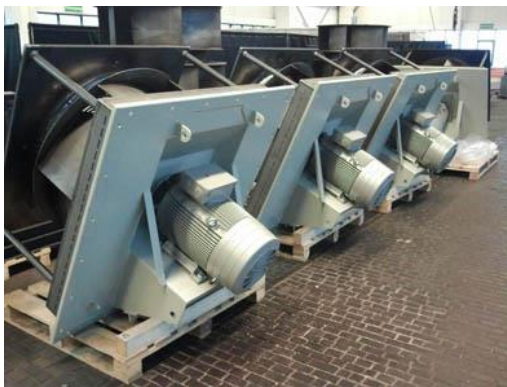
Bild Nr. 07-03 KK_BlueVentFertigung.jpg Karl Klein will die Arbeitsplätze in Thüringen erhalten. Die Mitarbeiter werden übernommen und weitere Arbeitsplätze sollen entstehen.