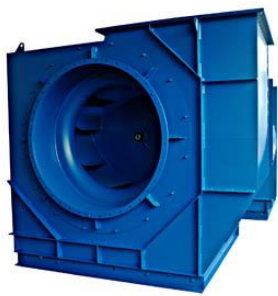
Bild Nr. 07-01 KK_BlueVent1.jpg Mit Wirkung vom 1. Mai 2014 hat die Karl Klein Ventilatorenbau GmbH die BlueVent Thüringen GmbH übernommen.