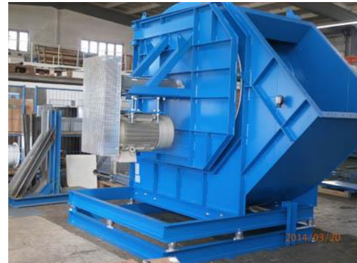
Bild Nr. 07-02 KK_BlueVent2.jpg Karl Klein erweitert mit der Übernahme der BlueVent Thüringen GmbH seinen Produkt- und Kompetenzbereich auf leistungsstarke Großventilatoren für den Maschinen- und Anlagenbau.