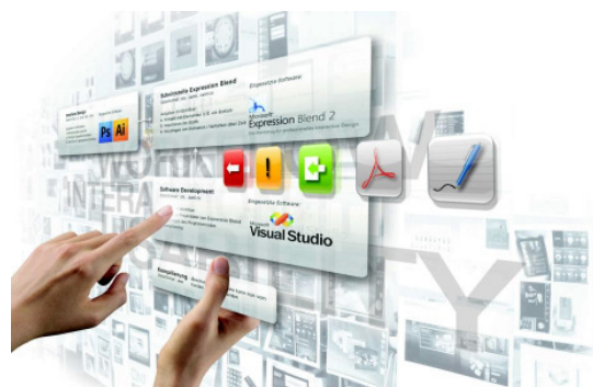
Ein Spezialgebiet der Design Agency ist das Interface Design. Immer mehr Produkte verfügen über eine solche Schnittstelle zwischen Anwender und Produkt - meist über ein Display.