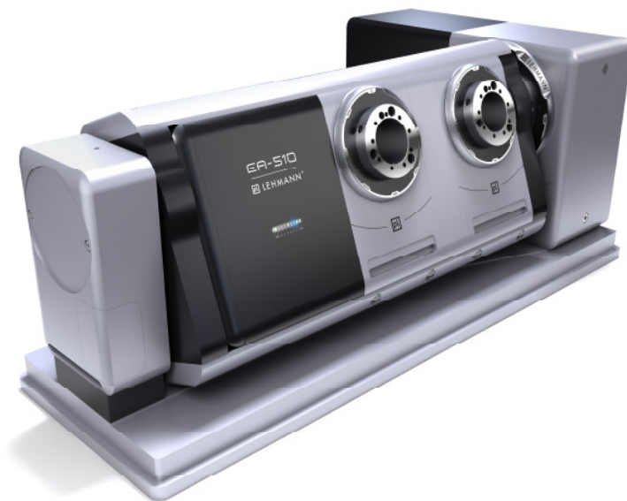
Abb.: Die modulare Bauweise lässt eine hohe Kombinationsmöglichkeit zu.

Die Oberfläche in Eloxal- und mattem Schwarz-Chrom setzt optisch deutliche Akzente. Das gewählte Material verspricht zudem Langlebigkeit und dauerhaften Farberhalt trotz Späneflugs, da die neue Oberfläche sehr kratzresistent ist. Ausgeprägtes CI-Element und das Zentrum der Maschine ist die Skalascheibe. Im Retro-Design gehalten werden die maschinentypischen Eigenschaften mit der typischen Lehmann-Kreuzfräsung kombiniert.