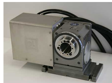
Oben: Die Lehmann EA-507 im alten Look