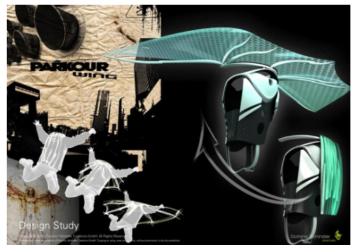
Ein dynamisch futuristisches Fun-Sportgerät – Kompakt gefaltet und rucksackartig auf den Rücken geschnallt, begleitet die Flughilfe den Sportler bei seinem Run durch die urbane Kulisse.