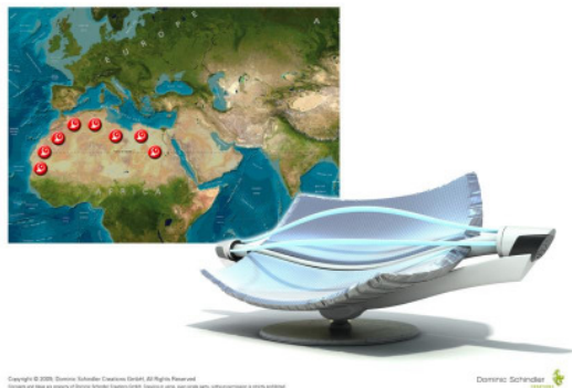
Das von Dominic Schindler Creations designte solarthermische Kraftwerk soll sauberen Strom aus den Wüstenregionen der Erde liefern.