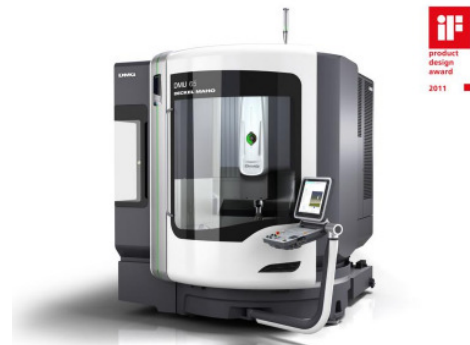
High-End Werkzeugmaschine – innovatives Produktdesign vereint anspruchsvolles und formvollendetes Design mit maximaler Funktionalität.