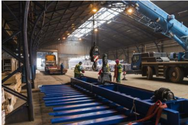
Istovar delova nove prese sa kamiona