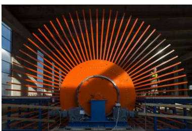
Okrentna zvezda iz profila