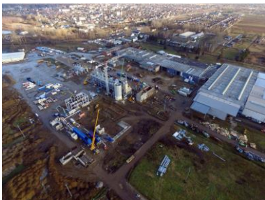
Na sredini slike: pogon snabdevanje energije i proizvodna hala, u pozadini: Vásárosnamény