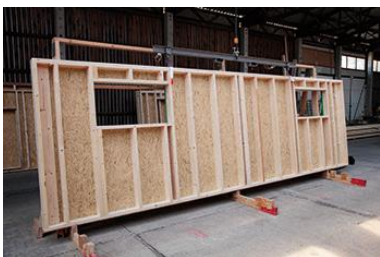
Priprema zidnih konstrukcija od SWISS KRONO OSB/3 bright ploča