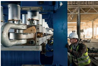
ContiRoll® presa cilindar