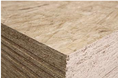
Nova SWISS KRONO OSB/3 bright svetlo bleđa ploča