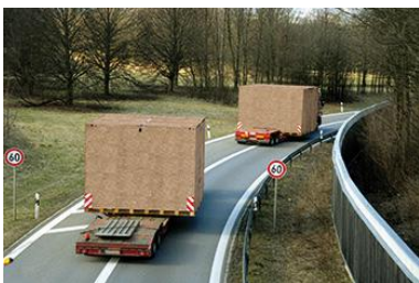
SWISS OSB/3 bright za pakovanje