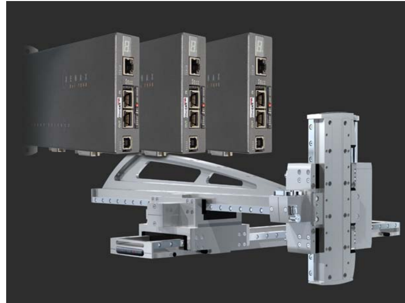
3 Achsen Flächenausleger: Dank Master-/ Slave Funktion kein übergeordneter Positionskontrolller notwendig

Telefon: +41 (0) 41 455 44 55 Fax: +41 (0) 41 455 44 50 E-Mail: alois.jenny@jennyscience.ch Internet: www.jennyscience.de