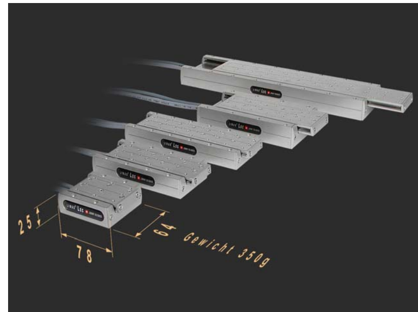
Baureihe LINAX Lxc, auch beim Gewicht eine Klasse für sich. Die kleinste Linearmotorachse wiegt nur 350g inkl. Führung und Messsystem.

Das Ergebnis sind kleinere Fabrikationshallen, höhere Produktivität, geringere Kosten: Mit anderen Worten hohe Effizienz.