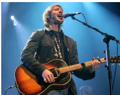
Der britische Folkpop Sänger James Blunt