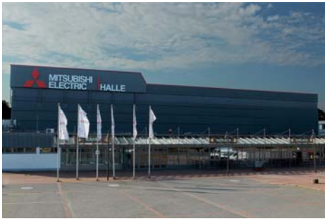
Das neue Gesicht der Mitsubishi Electric HALLE in der Siegburger Straße in Düsseldorf