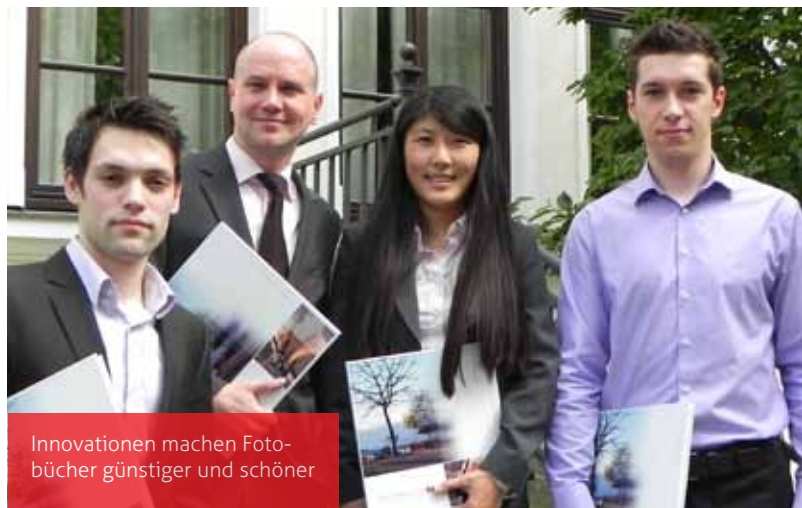
Innovationen machen Fotobücher günstiger und schöner