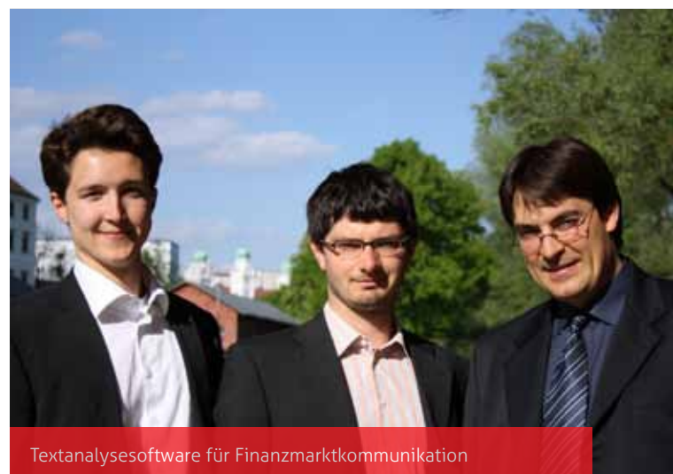
Textanalysesoftware für Finanzmarktcommunication