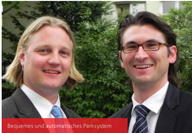
Bequemes und automatisches Parksystem

Herkunft Privatwirtschaftliches Unternehmen / Bayerisch Gmain