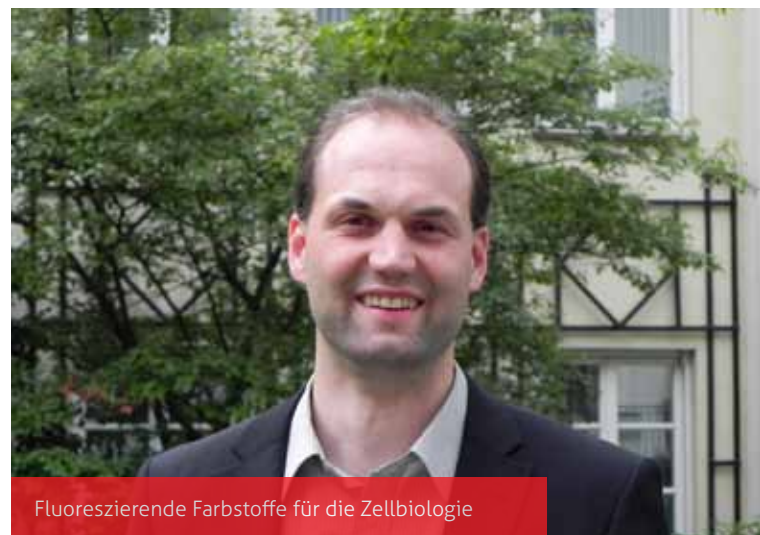
Fluoreszierende Farbstoffe für die Zellbiologie