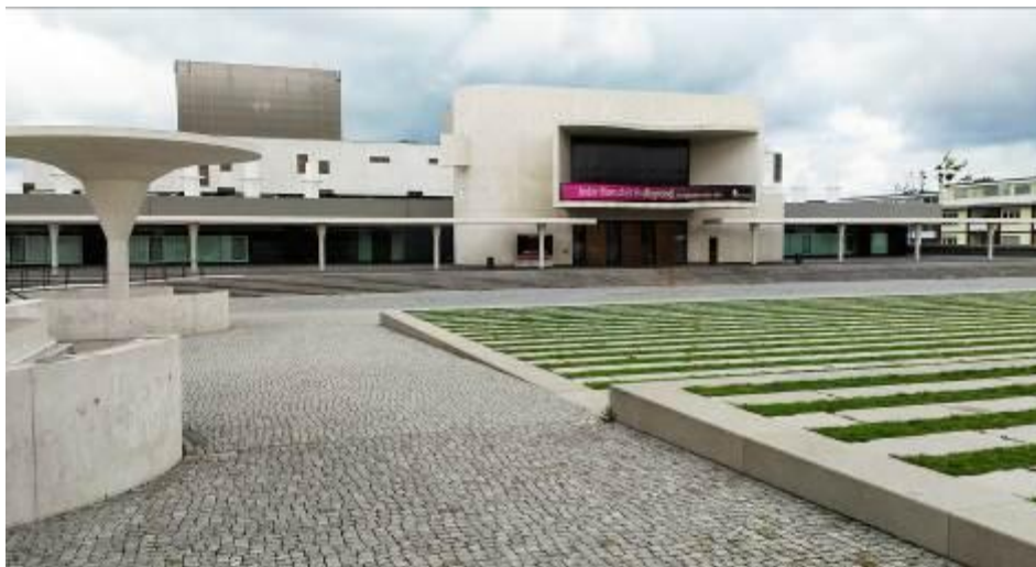
Bild 1: Arbeitet ab sofort mit dem Sony DWX Funksystem: Das Staatstheater Darmstadt