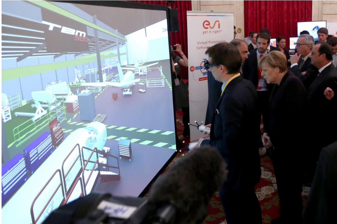
Image : ESI fait une démonstration au Palais de l'Élysée de sa solution de réalité virtuelle, ESI IC.IDO , utilisée chez Daher.

un catalyseur efficace pour améliorer l'écosystème européen de l'innovation et de la compétitivité industrielle. Pour ce faire, ESI participe à de nombreux projets de recherche financés par l'Union européenne par le biais de partenariats public-privé, incluant EFFRA et EGVI. »