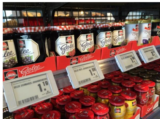
ESLs an einem Food-Regal im GS1 Germany Knowledge Center