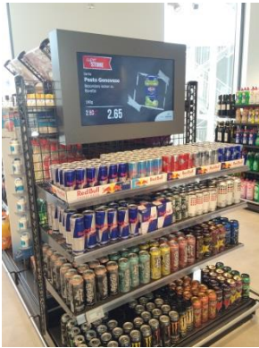
Bildschirmwerbung an einem Food-Regal im GS1 Germany Knowledge Center