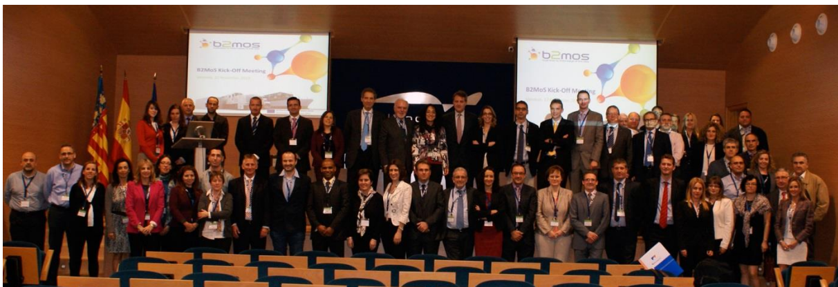
Kick-Off-Meeting B2MoS in Valencia, November 2013

Insgesamt 22 Partner sowie fünf ausführende Einrichtungen aus Spanien, Italien, Großbritannien, Griechenland, Slowenien und Deutschland realisieren das Projekt im Zeitraum Juli 2013 bis Dezember 2015 unter der Leitung von Fundación Valencia Port. Darüber hinaus sind weitere europäische Stakeholder, wie z. B. Reeder, Zoll- und Hafenbehörden, IT-Dienstleister und PCS-Betreiber, als interessierte Parteien in B2MoS involviert. Deutsche Partner sind neben dbh Logistics IT AG, Hafen Hamburg Marketing e.V. und DAKOSY Datenkommunikations AG.