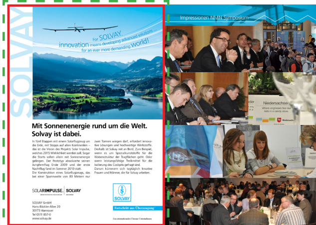
Beispielanzeige, Format 1/1-Seite A5