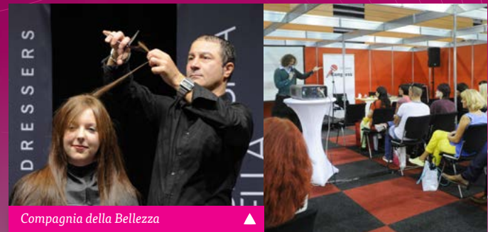
Compagnia della Bellezza ▲