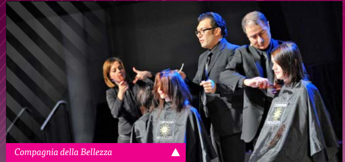
Compagnia della Bellezza ▲