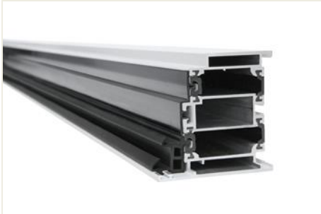
Profilschnitt Schüco ADS 75 SimplySmart

Verbund zwischen Isoliersteg und Aluminium-Außenschale den Bi-Metalleffekt minimiert.