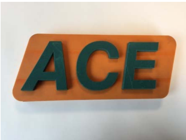
Bild 3 = ACE SLAB zugeschnitten RGB.jpg = 20 x 18 cm bei 300 dpi Auflösung

ACE SLAB Stoßdämpfungsplatten als Basis für diesen Musterzuschnitt des ACE Logos