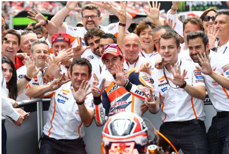
Der Spanier Marc Marquez sorgt für den 100. Honda Sieg in der MotoGP

Frankfurt / Barcelona – Mit dem Gewinn des Rennens in Barcelona durch Marc Marquez feiert die Honda Racing Corporation (HRC) den 100. Sieg seit der Einführung der MotoGP-Klasse im Jahr 2002.