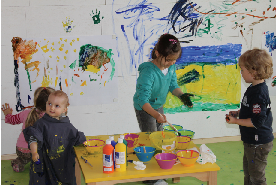
Malwand im relatio-Sonnenkinderland Frommern