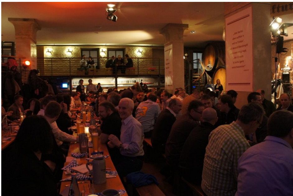
Bildunterschrift 6: An der traditionellen Abendveranstaltung wurde ganz nach der typisch bayrischen Lebensart in ungezwungener Atmosphäre gespeist und sich über verschiedenste Themen ausgetauscht.