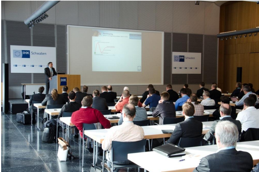
Bildunterschrift 1: Bereits zum 14. Mal fand der internationale Fachkongress CADENAS Industry-Forum in der IHK in Augsburg statt.