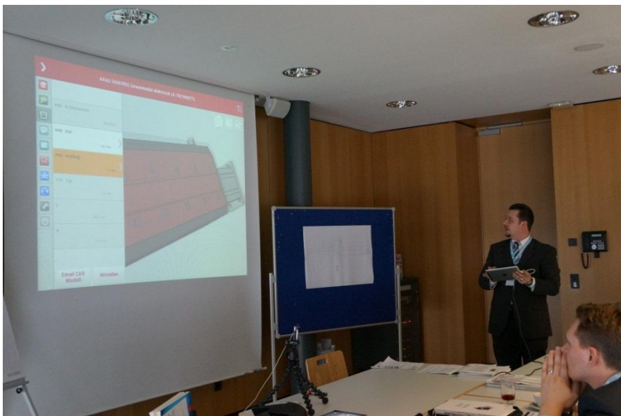
Bildunterschrift 2: In zahlreichen interessanten Vorträgen und Workshops konnten sich die Teilnehmer von den Vorteilen der Softwarelösungen von CADENAS überzeugen.