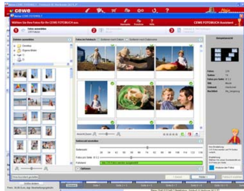
Spielend zum fertigen CEWE FOTOBUCH dank cleverer Navigation.