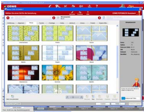
Mit der neuen CEWE FOTOBUCH-Software können zahlreiche Stile ausgewählt werden.