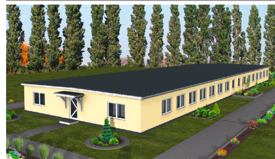
FLEXI HOME Typ 3 – eingeschossig mit Flachdach