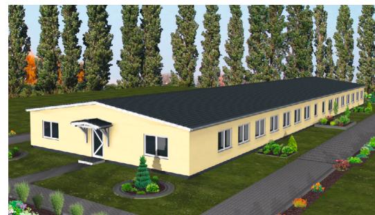
FLEXI HOME Typ 2 – eingeschossig