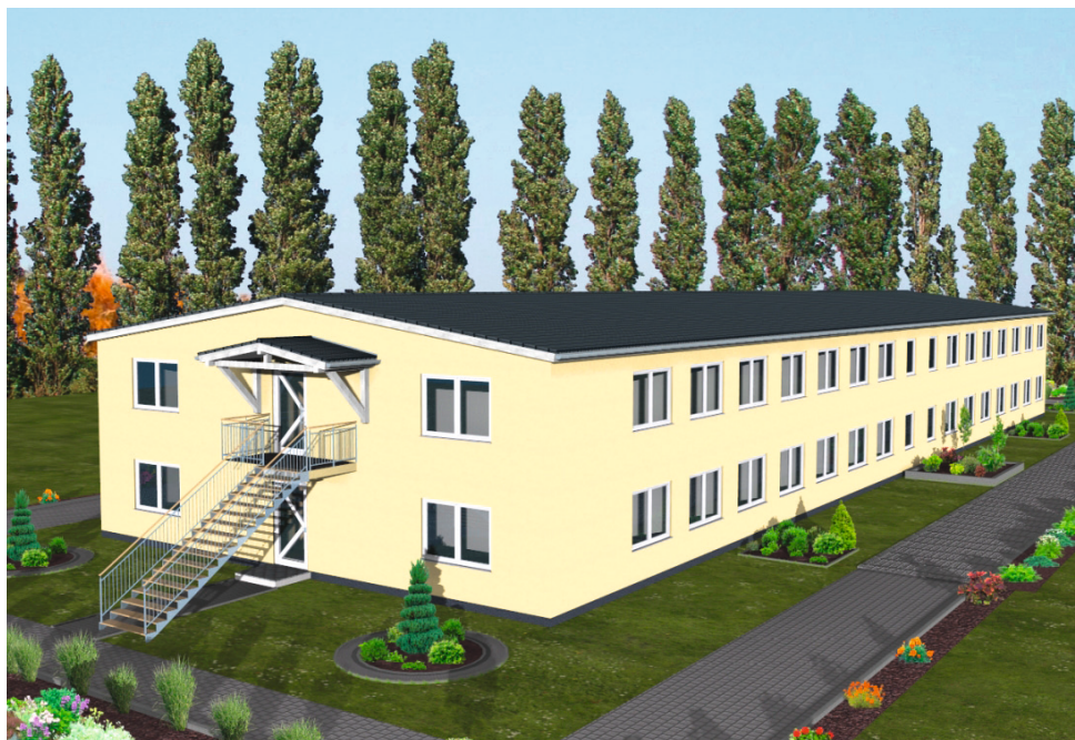
FLEXI HOME Typ 1 – zweigeschossig