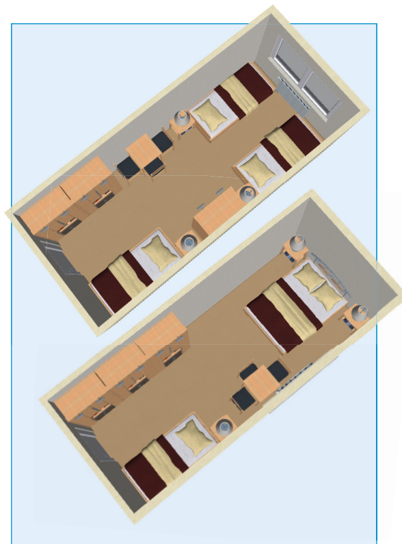
Modellansicht verschiedener Möblierungsvarianten