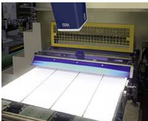
649_2 Schnellere Druckprozesse dank automatischer Einrichtung mit CoatSTAR