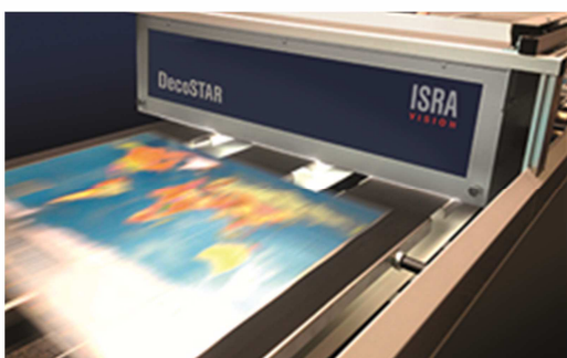
649_1 100 % Druckinspektion von bedruckten Metalltafeln mit DecoSTAR