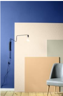
Farbwelt 1: Blickfang Terra, Blau und Khaki