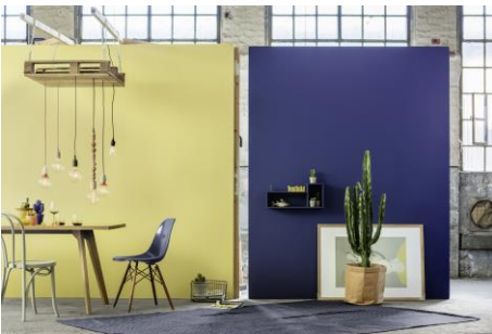
Farbwelt 3: Blickfang Cognac, Blau und Gelb