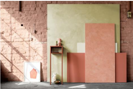
Farbwelt 4: Blickfang Rot und Schilf