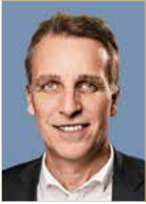
Minister Stefan Wenzel Niedersächsischer Minister für Umwelt, Energie und Klimaschutz