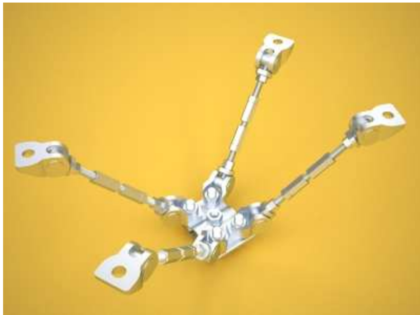
BU 4: SIKLA Austria GmbH - Festpunktspinne.