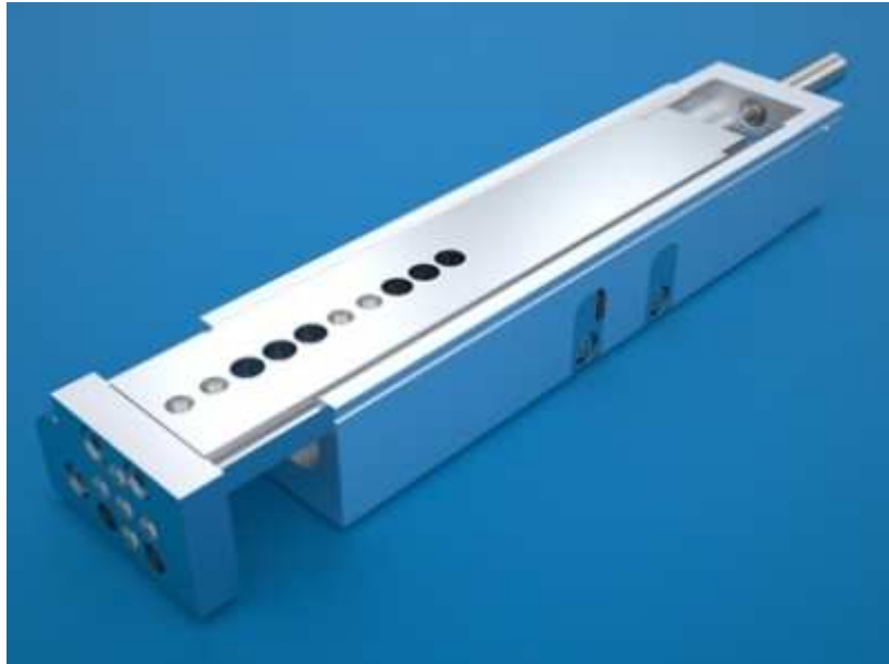
BU 3: Festo AG - DGSL.