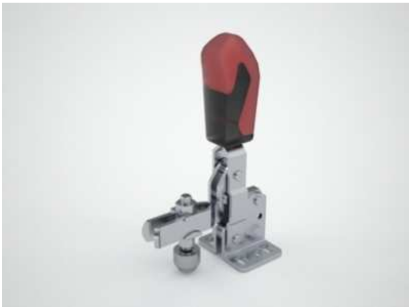
BU 2: AMF Andreas Maier GmbH - Spanner.