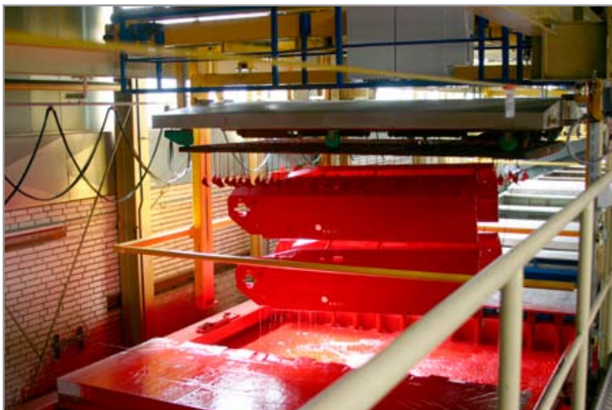
Grafik: Tauchlackieranlage für Agrarmaschinenteile