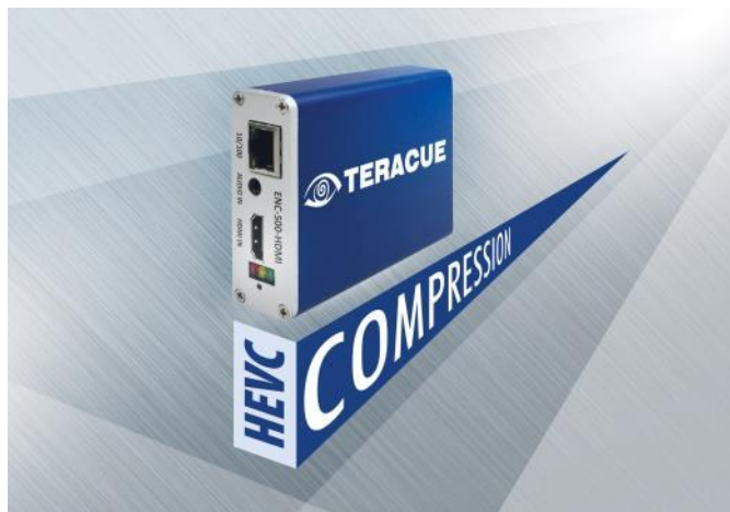
ENC-500-HDMI Streaming Encoder mit HEVC

Klein und kompakt aber stark in der Komprimierung: Der neue ENC-500 streamt Ihr HDMI Videosignal in HEVC/H.265 oder H.264 mit vier verschiedenen Protokollen: RTSP, RTMP, HTTP und UDP. Der ideale Encoder für Internet, OTT und IPTV.