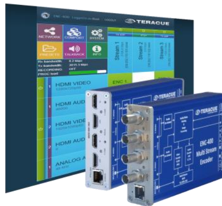
ENC-400-HDS/SDI oder HDMI H.264 Dual Input Encoder

Der ENC-400 ist ein lüfterloser H.264 Videoencoder zur Übertragung multipler Streams an verschiedene Ziele mit unterschiedlichen Bitraten und Protokollen. Der eingebaute Framesynchronizer garantiert dabei eine stabile Signalverarbeitung. Beide Eingänge bieten einen durchgeschliffenen Ausgang und können als Redundanz oder zur Übertragung von zwei individuellen Eingangssignalen verwendet werden. Neben neuester H.264 Encoding Technologie unterstützt der ENC-400 auch das ältere MJPEG Format für Livestreaming und Aufzeichnung. Durch das geringe Gewicht sowie das kompakte und lüfterlose Aluminiumgehäuse ist das Gerät zudem tragbar und nicht zuletzt dadurch die ideale Lösung für Broadcasting, IPTV und Webcasting.