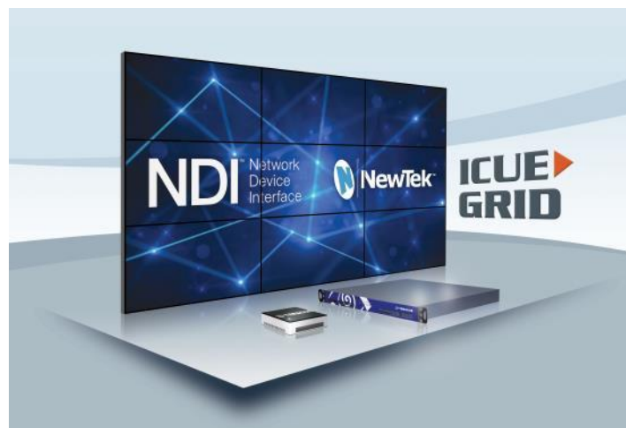
ICUE-GRID IP Videowall

Erstellen Sie Ihre Live Produktionen und Sendungen mit NewTek's NDI™ Protokoll und Ihr Netzwerk kann gleichzeitig mehrere hochqualitative, nahezu latenzfreie Videostreams darstellen. ICUE-GRID Multi Room IP Videowall Management.