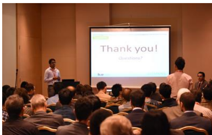
Gut besucht: Das Vortragsprogramm der ITSC 2016 in Schanghai, China.