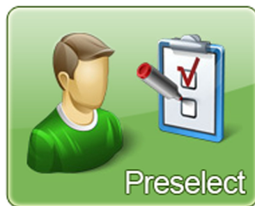
Die richtige Auswahl beginnt mit der Festlegung der Rahmenbedingungen

Bei Toolevaluierungen ist man im ersten Schritt damit konfrontiert, eine Vorauswahl von Tools zu treffen, die für eine Evaluierung in Frage kommen. Da-