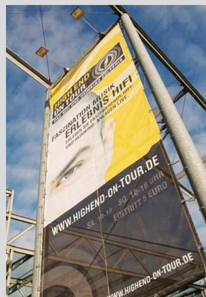
Plakat HIGH END ON TOUR > Bild herunterladen picture download