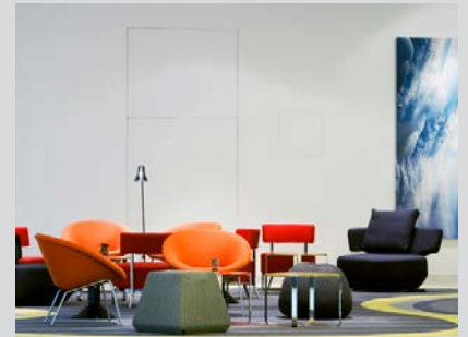
andel`s Hotel Berlin

Neben der Haptik kommt natürlich auch der Optik eine entscheidende Bedeutung zu. Hi-Fi, Video und PC-Technik verschmelzen zunehmend miteinander. Im Zuge dieser Entwicklung wandert der Computer auch ins Wohnzimmer und fungiert dort als Multimedia-Zentrale. Die gute alte Stereoanlage ist aber immer noch zentraler Mittelpunkt in den Wohnzimmern dieser Welt und erlebt gerade ein Revival, nicht nur als Retro-Objekt, sondern vielmehr auch als optimale Voraussetzung für einen tollen Sound. Durch die Digitalisierung ist jedoch auch eine neue Mobilität entstanden. Via Bluetooth, Kabel oder WLAN kann überall der Lieblingsmusik gelauscht werden. Auf der HIGH END ON TOUR können die Besucher nicht nur hochwertige HiFi- und Heimkino-Komponenten mit bester Wiedergabetechnik und überragender Tonqualität erleben, sondern auch edle Designjuwelen, die integrierter Bestandteil des modernen Wohnens sind.