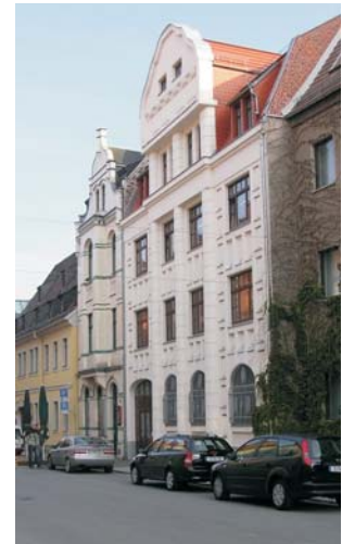
Gebäude Peter-Breuer-Str. 8

Am Mittwoch, dem 16.7., begeben sich die Schüler auf eine Ganztags-Exkursion. „Umwelt und Bergbau im Erzgebirge - Sammeln und Analyse von Gesteinsproben“ lautet hierzu das Thema.