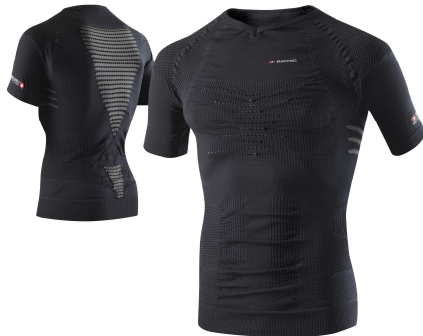
Mit Hightech Underwear optimal temperiert im Sommer auf Tour.

Bleibt der Schweiß aus, speichern die Kanäle und Hohlräume warme Luft und schaffen ein isolierendes Luftpolster. Dadurch muss der Körper weniger Energie für die Thermoregulierung aufwenden. Es steht mehr Energie für die Leistungsfähigkeit zur Verfügung. Am Berg bedeutet dies mehr Sicherheit, insgesamt mehr Ausdauer.