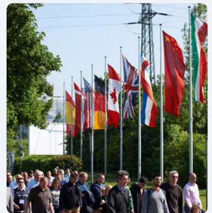
Fachbesucher aus der ganzen Welt