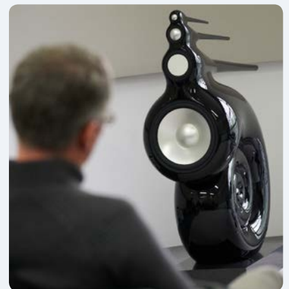
Klang und Form > Bild herunterladen picture download