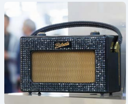
Radio Variation > Bild herunterladen picture download