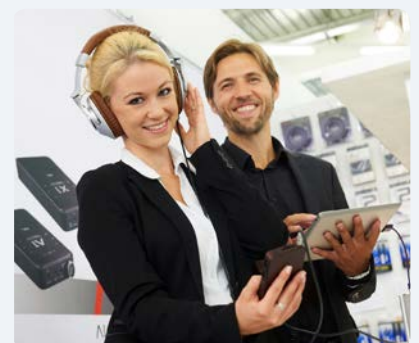
Probegören > Bild herunterladen picture download