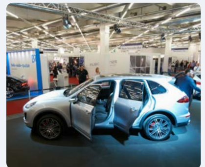
HIGH END ON WHEELS