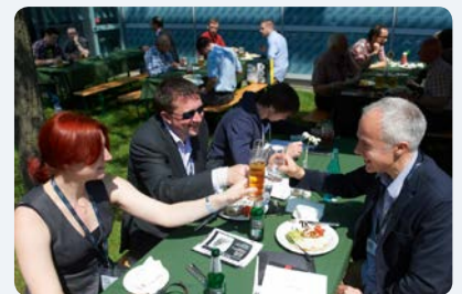
Biergarten und gutes Wetter