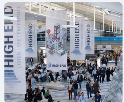
Atrium im MOC