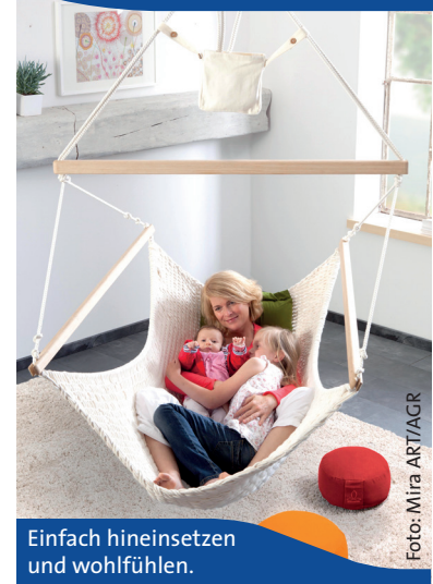
Einfach hineinsetzen und wohlfühlen.

Viele Rückenbeschwerden hängen di- rekt mit Stress im Alltag zusammen. Daher ist es wichtig, zwischendrin im- mer wieder mal die Seele baumeln zu lassen. Und wo geht das besser, als in einer Hängematte? Das Problem hierbei: Herkömmliche Hängematten finden im Privatbereich oft keinen Platz, weil sie an zwei Enden befestigt werden müs- sen und somit viel Platz benötigen, der oft nicht vorhanden ist. Ganz anders hingegen sogenannte Hängestühle: Sie werden mittels einer Ein-Punkt-Auf- hängung an der Zimmerdecke befestigt und nehmen nicht viel mehr Fläche in Anspruch als herkömmliche Wohnzim- mersessel. Die Art der Aufhängung sorgt für ein sanftes Kreisen und Pendeln – so fühlt man sich schnell entspannt und geborgen. Darüber hinaus fördert das Schwingen und Schaukeln die Körper- wahrnehmung und entfaltet eine beru- higende, entspannende und entkramp- fende Wirkung. Ihr weiches, knoten- freies Netzgeflecht passt sich optimal an den Körper an – Druckstellen werden vermie- den. Damit verschiedene Personen den Hängestuhl in unterschiedlichen Situa- tionen nutzen können, sollte dieser sich leicht in Höhe und Neigung verstellen lassen. Wer auf der Suche nach einem geeigneten, rückengerechten Hänge- stuhl ist, wird zum Beispiel bei Mira ART fündig. Weitere Infos gibt es unter www. agr-ev.de/haengestuehle .