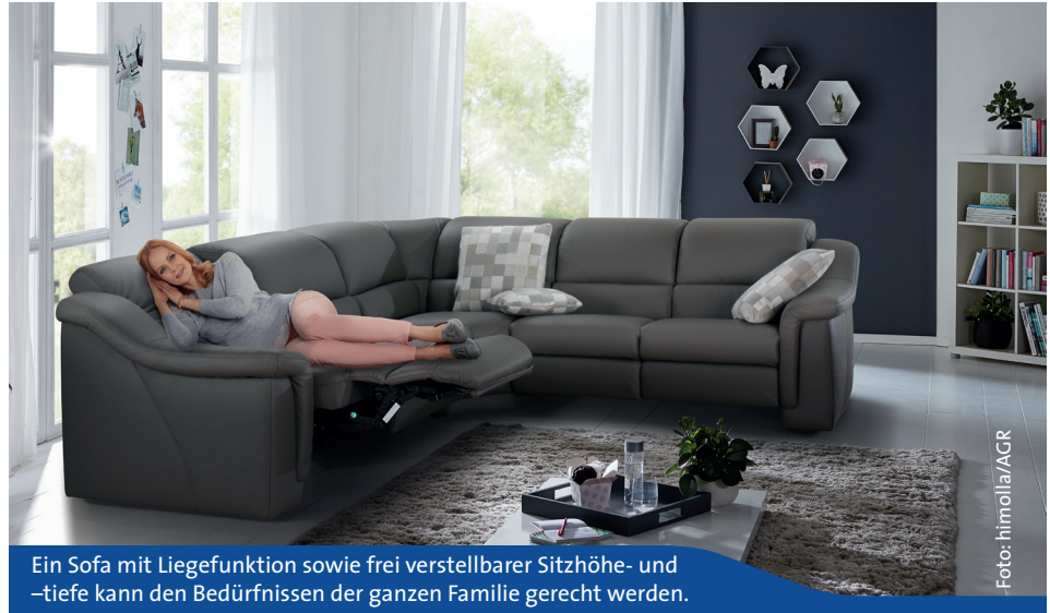
Ein Sofa mit Liegefunktion sowie frei verstellbarer Sitzhöhe- und –tiefe kann den Bedürfnissen der ganzen Familie gerecht werden.

und –tiefe sowie eine ausreichend breite Sitzfläche. Um die Wirbelsäule ausreichend zu stützen, sollte der Stuhl über eine anatomisch geformte Rückenlehne verfügen. Der Stuhl muss zudem bewegtes Sitzen erlauben und die Pol-