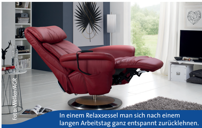
In einem Relaxsessel man sich nach einem langen Arbeitstag ganz entspannt zurücklehnen.

Im höheren Alter gewinnen Sitztätigkeiten oft stark an Bedeutung. Der Grund sind häufig Einschränkungen hinsichtlich der Mobilität, wie Gelenkverschleiß und der allmähliche Rückgang der Muskulatur. Aufstehsessel können hier Abhilfe schaffen: Sie unterstützen durch ihren elektronischen Hebe- und Senkmechanismus die natürliche Aufsteh- und Hinsetzbewegung. Durch ihre Stützfunktion nehmen sie zudem Druck von den Gelenken, entlasten Muskulatur und Wirbelsäule und motivieren zur Mobilität. Aufstehsessel werden Tag ein Tag aus von ein und derselben Person