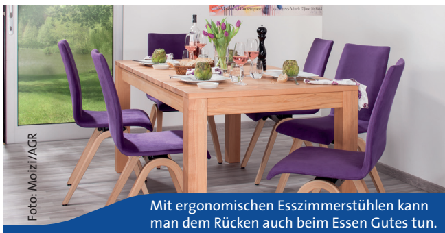
Mit ergonomischen Esszimmerstühlen kann man dem Rücken auch beim Essen Gutes tun.

Vor allem beim Essen achten viele auf möglichst gesunde Zutaten und schonende Zubereitung. Doch nicht nur die Mahlzeiten an sich, auch die Sitzhaltung beim Essen ist entscheidend, um sich dauerhaft wohl zu fühlen. Speziell für den Einsatz am Esszimmertisch entworfene Sitzmöbel sollten nicht nur bequem und stilvoll, sondern auch ergonomisch gestaltet sein. Wichtig sind insbesondere eine passende Sitzhöhe