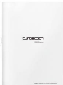
Foto: Euroboden_Edition01_cover_.tif BU: Euroboden Edition 01 - Cover technischer Teil