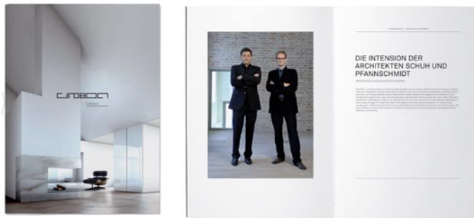
Foto: Euroboden_Edition01_Expose_Cover.tif; Euroboden_Edition01_Expose_Layout.tif BU: Euroboden Edition 01 - Cover und Doppelseite