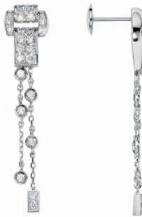
Ohringe Miss Protocole Weißgold, besetzt mit 50 Diamanten Preis: 5.250,-- Euro