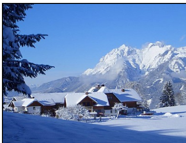
Gewinnerfoto des CEWE COLOR Winterwettbewerbs 2010: Mario Neumann aus Hilbersdorf in Sachsen

Weitere Informationen zum CEWE FOTOBUCH sowie zu aktuellen Gewinnspielen sind erhältlich unter www.cewe-fotobuch.de .