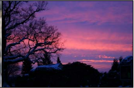
6. Platz: Erika Eckelmann