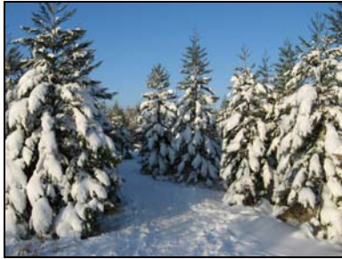
4. Platz: Petra Radtke