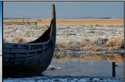
9. Platz: Isabell Kulbe