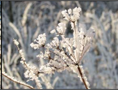
5. Platz: Cornelia Anders