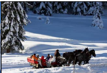
2. Platz: Marlies Stockmann