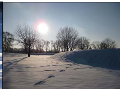
3. Platz: Nadine Steffens