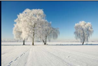
8. Platz: Achim Jockschat