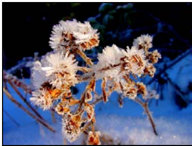
10. Platz: Judith Schmidt

Bei Rückfragen wenden Sie sich bitte an: