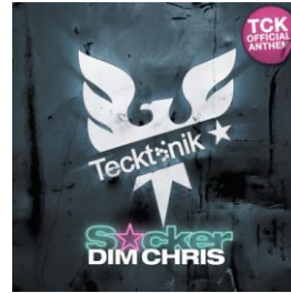
Official TCK Compilation / Official TCK Anthem