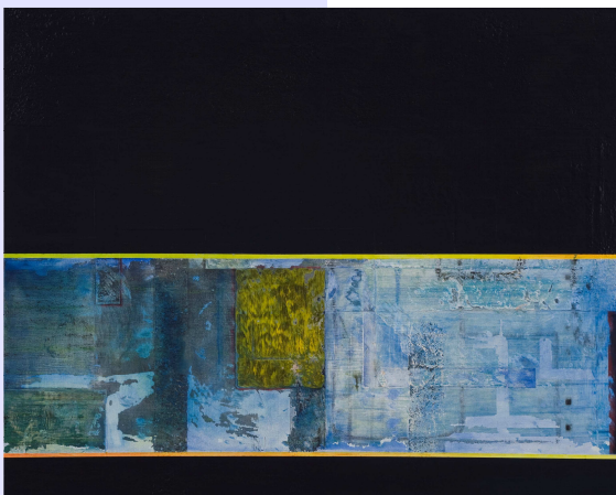
Mixed Media auf Leinwand, 80x100 cm

Am 22. April 2010 ab 19:00 Uhr , findet die Vernissage zur Ausstellung von HANS CASTRUP in Anwesenheit des Künstlers in den Räumlichkeiten der affinis consulting GmbH in Hamburg, Flughafenstraße 52, statt. Der Künstler lebt und arbeitet freischaffend auf den Gebieten Malerei, Grafik, Fotografie und Musik in Bramsche bei Osnabrück.