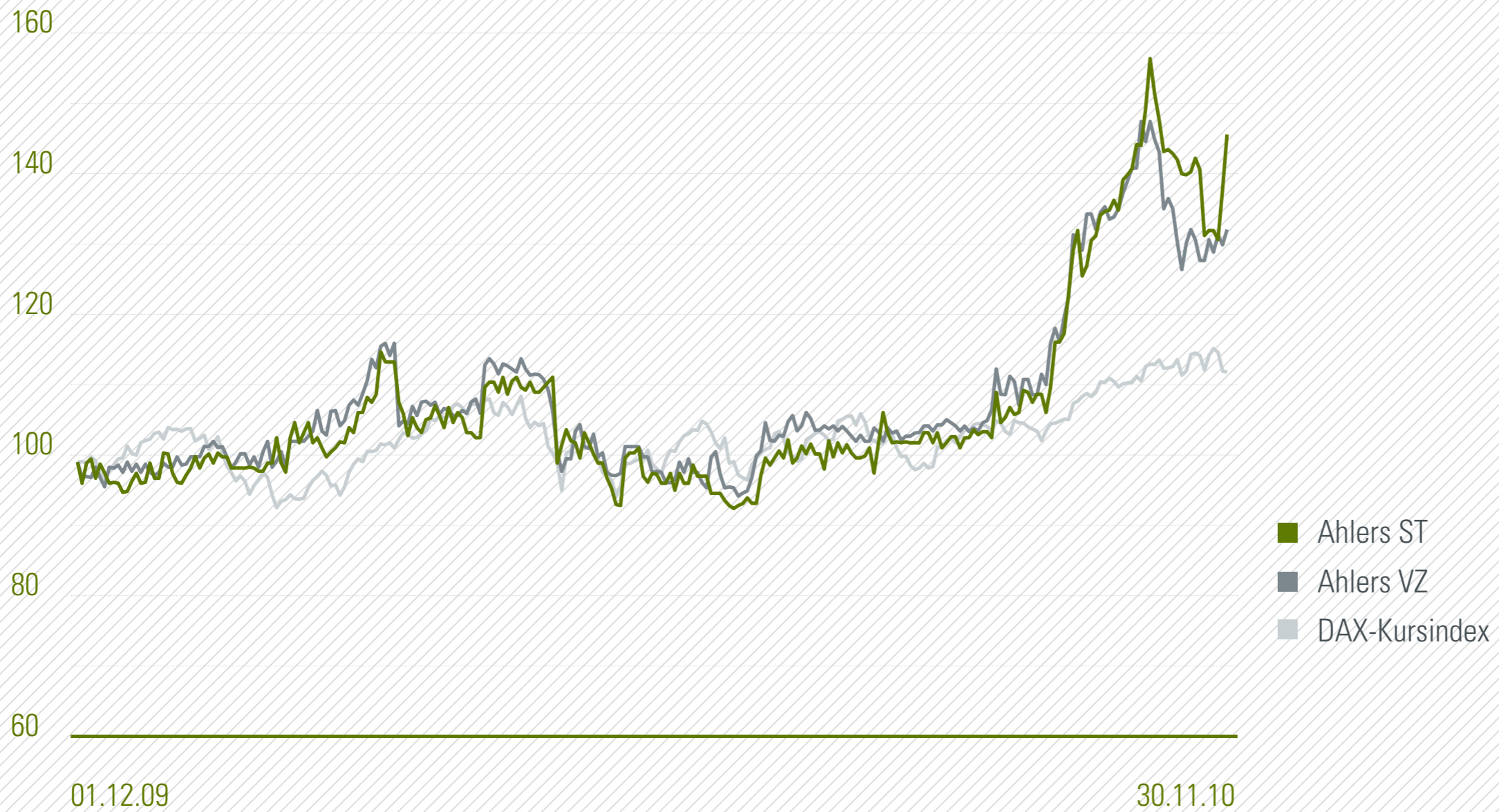
Kursentwicklung Ahlers-Aktien im Vergleich zum DAX