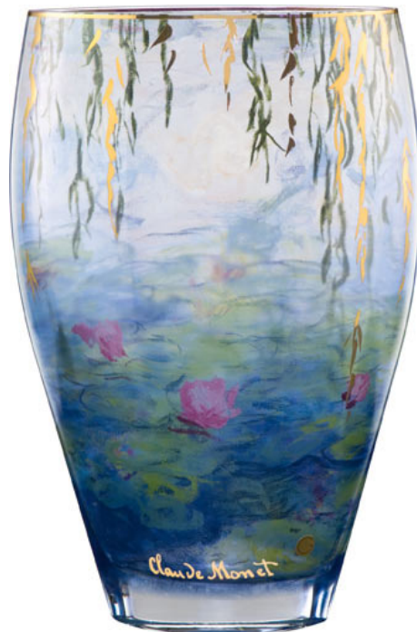
Seerosen mit Weide Vase, Glas, Höhe: 50 cm 67000117, UPE € 299.00