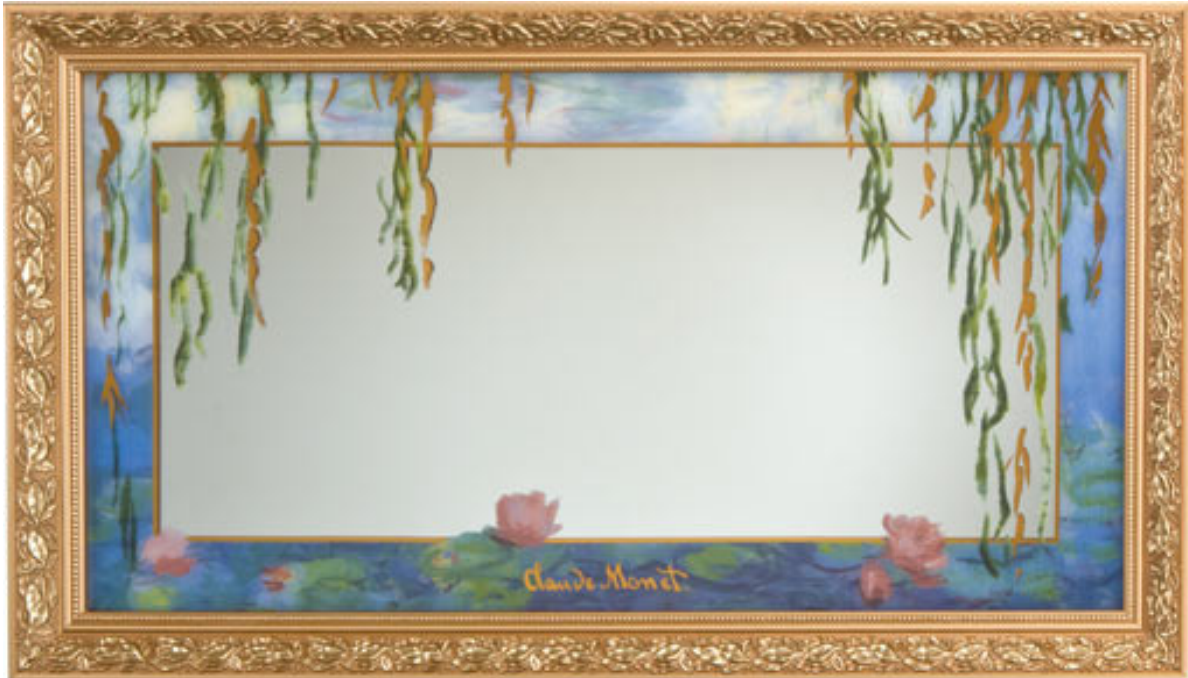
Seerosen mit Weide Spiegel, Glas, 84 x 48 cm 67000109, UPE € 429.00